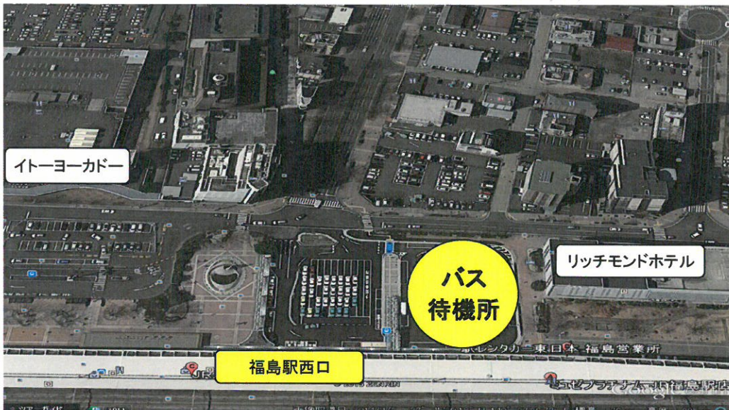
送迎バス待機所地図

福島駅西口 ⇄ 野地温泉ホテル 片道約50分 専用駐車場 ⇄ 野地温泉ホテル 片道約30分